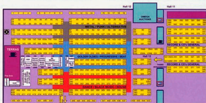
Översiktskarta över den stora mässhallen. Det finns fler hallar...

Nästa dag är den första lik. Mer folk. Mer troll. Mer gubbar. Kvinnorna lyser med sin frånvaro, även om de existerar. I sammanhanget verkar kvinnor inte över huvud taget bry sig om huruvida en platta är en originalpressning eller inte. De kollas ofta inte ens skicket. De är bara ute efter kvaliteten på själva musiken. Det är enormt befriande med den inställningen och vi skivsamlarmän har en hel del att lära här. De frågar efter en platta med Neil Young och när den presenteras blir de uppriktigt glada. Här ska det spelas musik. De tackar och går vidare. Gubbarna grymtar till och ser missnöjda ut även om de prutat ner en skiva med 100 euro. De ska ändå inte lyssna och är väl medvetna om att konsumerandet kommer med en enorm antiklimax som