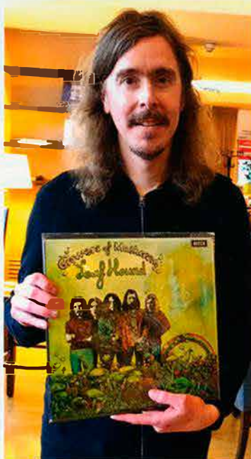
Många års letande är över! Drömskivan av Leaf Hound är äntligen inköpt. Dubbelt så dyr som Bathory »Gula geten«.

S jälva skivmässan tar fart. Det är enormt. Jag har aldrig sett så mycket skivor i hela mitt liv. Jag uppskattar mässan till ungefär tre stycken flygplanshangarer fullproppade med vinyl. Den eviga svenska reabackskivan »Pelles gröna« syns inte till någonstans. I stället ser jag kanske 30 exemplar av Beatles mytomspunna samlingskiva från 1966, »Yesterday