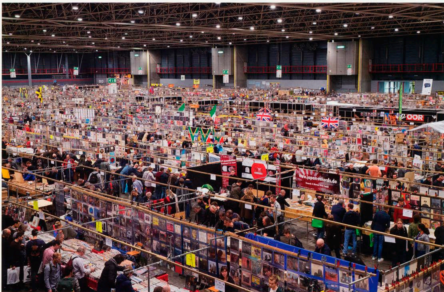
På bilden syns kanske en fjärdedel av flygplanshangaren som är proppfull med allt från skräp till ultrarariteter.

and today« eller »Butcher cover« som den också kallas. Det är fullkomligt befängt. En säljare har »frontat« King Crimson's debutalbum på en hel vägg som är fem gånger tio meter vid. Precis som omslagsbilden står jag bara där och gapar.